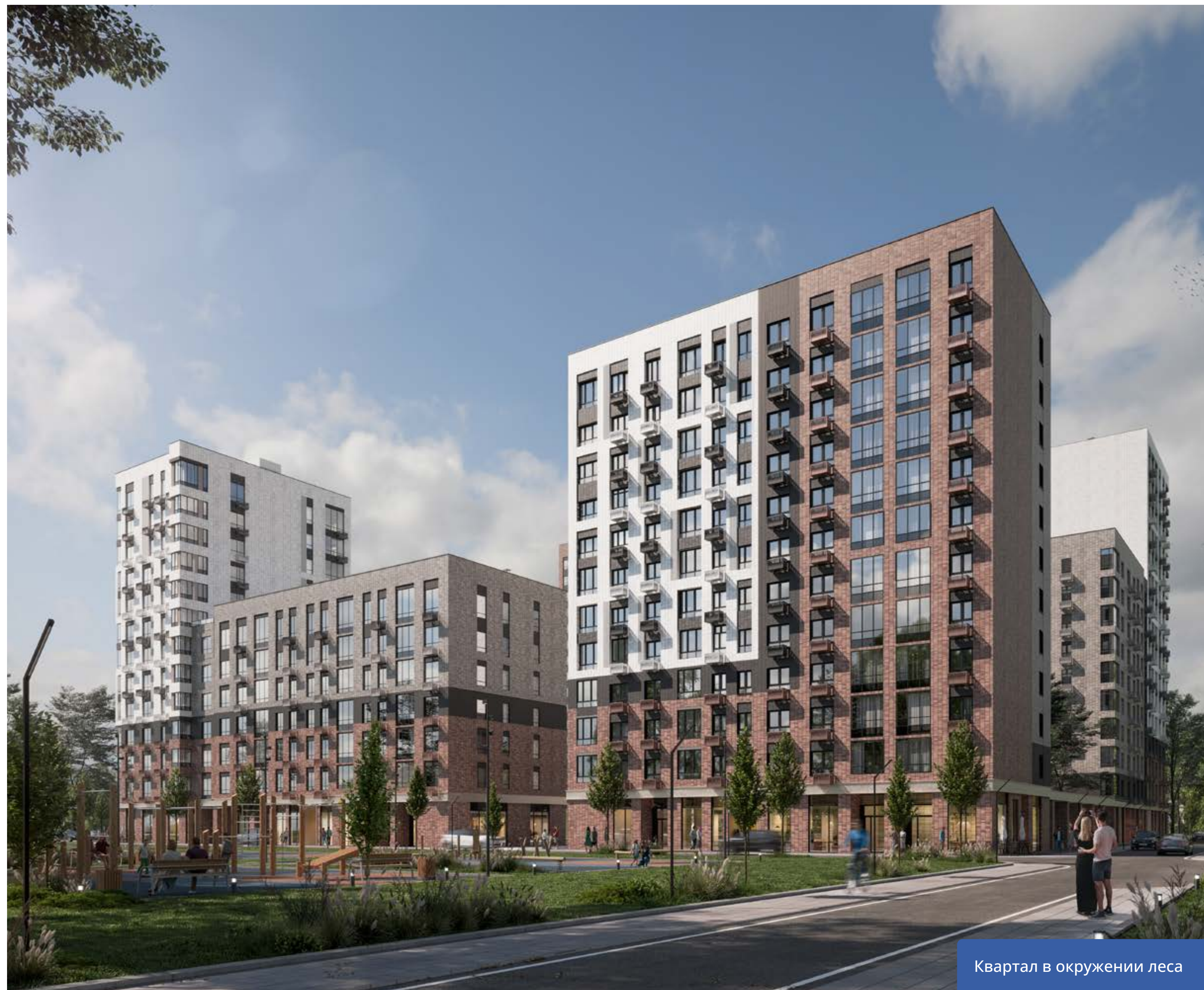
Квартал в окружении леса